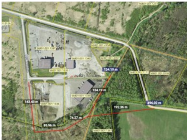
Joonis 1. Alternatiivne teekoridor Maa-ameti kaardi väljavõttel.